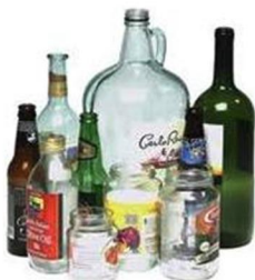
Botellas de vidrio