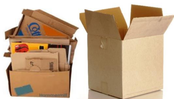
Cartón y cajas con alimentos secos