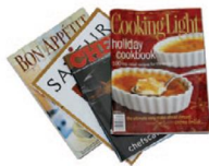
Revistas, catálogos e informes