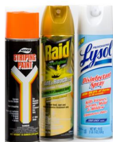
Envases de aerosol vacíos