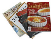
Magazines, catalogs and reports