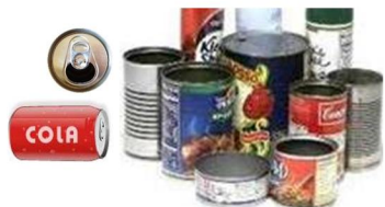
Latas de aluminio y hojalata