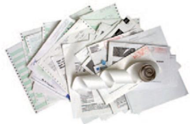
Papel blanco y de colores, periódicos y formularios sin papel carbón