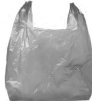
الأكياس والأغلفة البلاستيكية