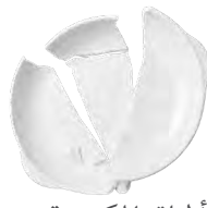
الأطباق المكسورة والمرايا