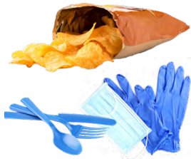
البلاستيك غير القابل لإعادة