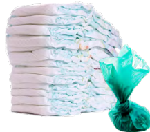
الحفاضات ومخلفات الحيوانات الأليفة