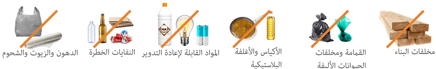
الدهون والزيوت والشحوم