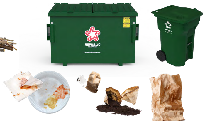
الأوراق والأكياس الورقية الملوثة بالطعام