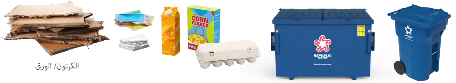
الكرتون / الورق