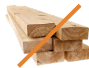
Residuos de la construcción