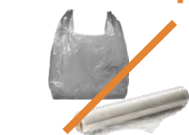
Bolsas de plástico y envolturas