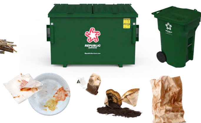
Papel y bolsas de papel con residuos de comida