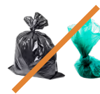
Basura y desechos de mascotas