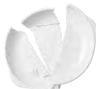
Platos rotos y espejos