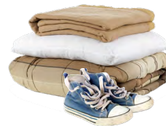
Ropa y ropa de cama