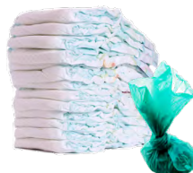
Pañales y excremento de mascotas