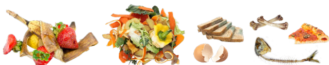
Desechos de alimentos