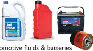
Automotive fluids & batteries Baterías y líquidos para automóviles

Cuando ya no quiera los productos tóxicos que se muestran abajo, llévelos a las instalaciones de recolección de desechos domésticos peligrosos de West Contra Costa (West Contra Costa Household Hazardous Waste (HHW)) para que los reciclen o los desechen en una forma segura.