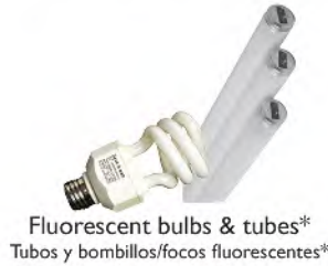
Fluorescent bulbs & tubes* Tubos y bombillos/focos fluorescentes*