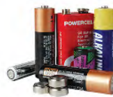
Household batteries* Baterías y pilas*