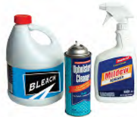
Household cleaners, aerosols & sprays Aerosoles, rociadores y productos de limpieza