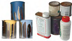
Paints, stains & solvents Pintura, barniz y disolvente