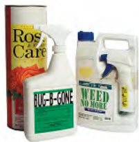
Pesticides, garden chemicals & pool chemicals Pesticidas, productos químicos para jardines y piscinas