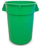
32 GALONES, REDONDO CON TAPA 28" H

No, estos artículos se consideran contaminación